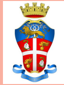
Arma dei Carabinieri