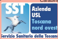
ASL Toscana Nord Ovest