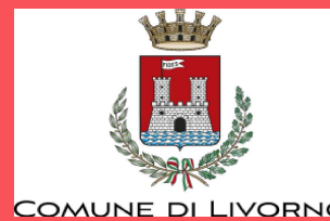
COMUNE DI LIVORNO