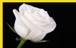
Rete Alba Rosa