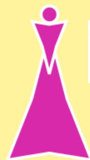
Centro Donna Comune di Livorno