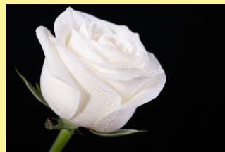
Rete Alba Rosa